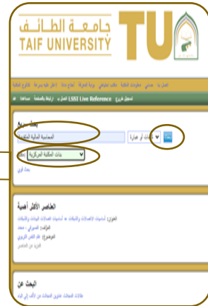
١- البحث بـ (عنوان الكتاب أو اسم المؤلف أو الموضوع) واختيار المكتبة ثم بحث.

ملاحظة: التصنيف المتبع في المكتبة هو تصنيف ديوي العشري مقسم الى (١٠) اقسام رئيسية كما هو موضح بالأسفل.