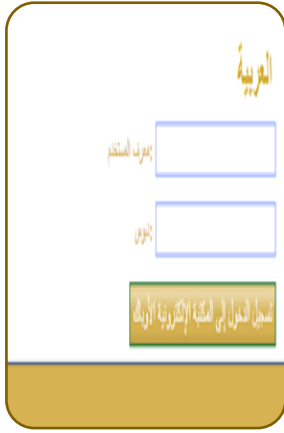
٤- تحديد لغة البحث.