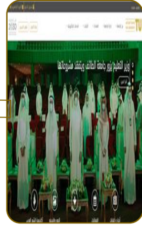
١- الدخول لموقع جامعة