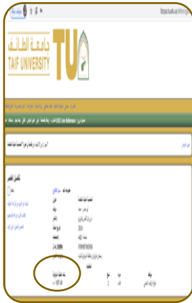
٣- تظهر جميع بيانات الكتاب البيبلوجرافية، يتم الاحتفاظ برقم التصنيف للبحث على الرف من خلاله.