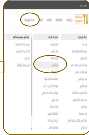
٢- الخدمات الإلكترونية.